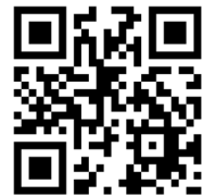
Galonisarna – Mossa