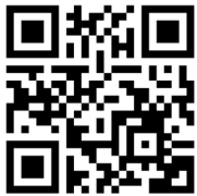
Visste du? – Så görs papper av träd