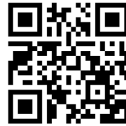
Galonisarna – Kotte